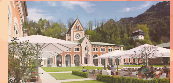
Die schönste Sonnenterrasse in Bad Reichenhall

»Vater werden ist nicht nicht schwer, Vater sein dagegen sehr!« (Wilhelm Busch) Liebe Väter! Nutzen Sie das Salin: Rundum-Sorglos-Vatertags-Package. Spanferkelhaxe mit Krautsalat und Kräuterknödel. Dazu ein Dunkelbier und zwei Williams Birne (da sich bekanntermaßen auf zwei Beinen besser steht.)